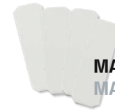
MAGNETKLEBEPLÄTTCHEN MAGNETIC ADHESIVE PLATES

DEIN NEUES MOSKITONETZ HAFTET AUSSCHLIESSLICH MIT EINGENÄHTEN MAGNETEN UND JE NACH MODELL WIRD ES MIT WEITEREN HILFSMITTELN ZUSÄTZLICH FIXIERT. ES IST ALSO MIT WENIGEN HANDGRIFFEN KINDERLEICHT AN DEIN FAHRZEUG ANZUBRINGEN.